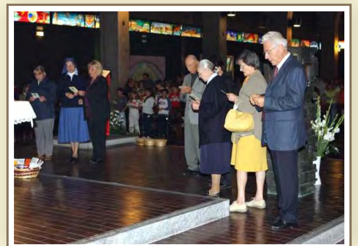
I Ministri dell'Eucarestia