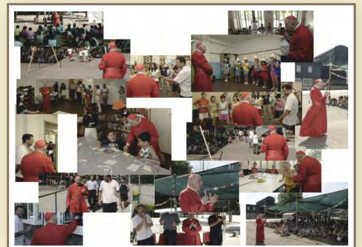
Estate 2008 - Il Card. Tettamanzi al nostro oratorio estivo