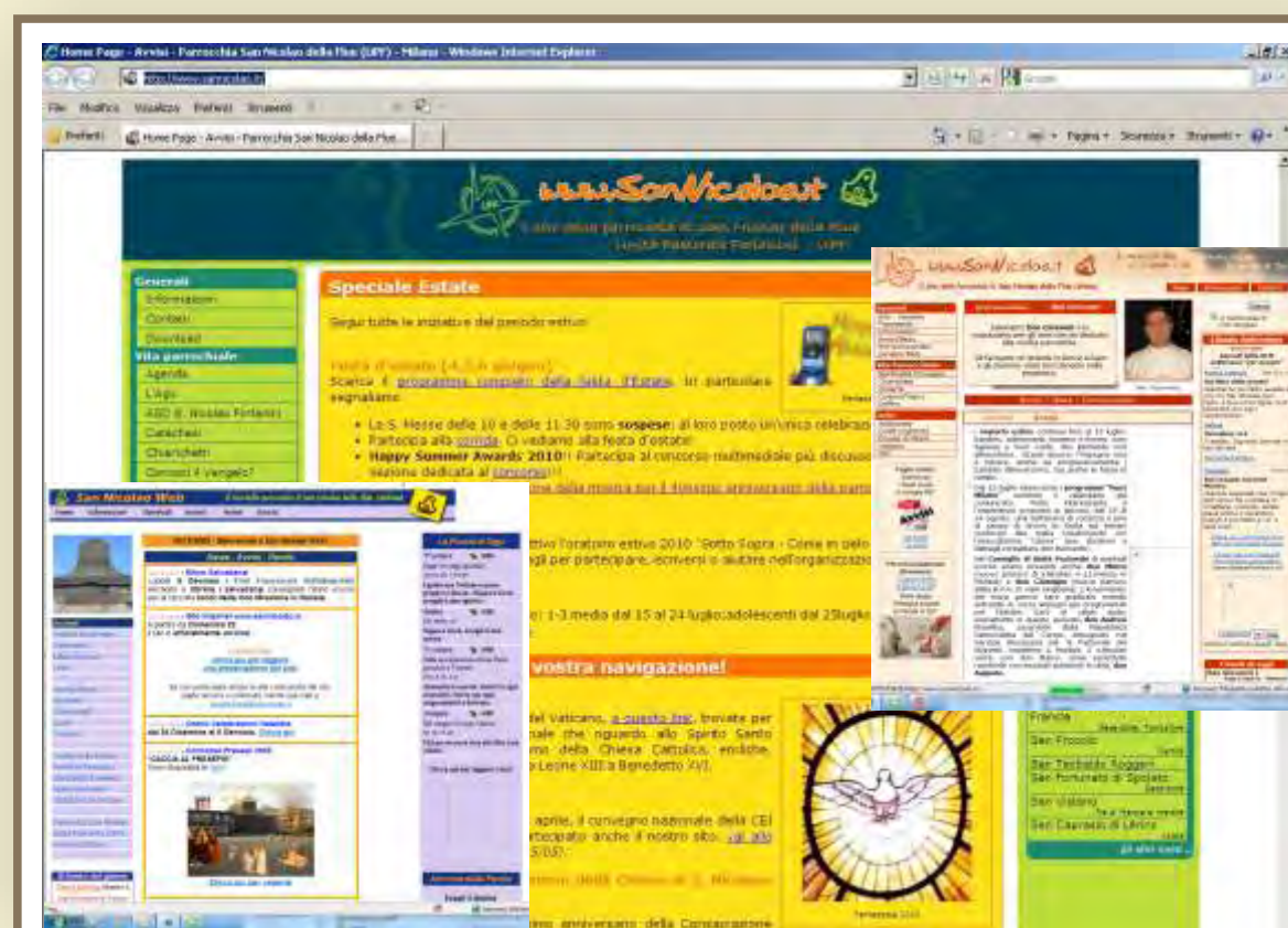
Nel 2002 è online il sito www.sannicolao.it